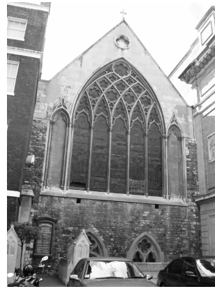
Pieni, roomalaiskatolinen kirkko sijaitsee talorivistön keskellä, hieman kauempana tiestä.

Mitre -pubiin, jonka historiasta kerrotaan monia värikkäitä tarinoita.