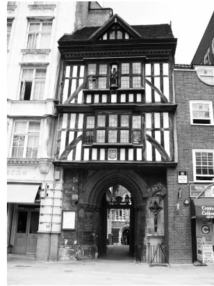
Portin alaosa on 1200-luvun kirkkolaivan oviaukko, ja yläosan hirsirakennus on 1500-luvulta

1200-luvun alussa, mutta kirkoille tyypilliseen tapaan siihen on kertynyt rakenteita eri aikakausilta. Keskiajalla St. Helen oli käytännössä kaksi eri kirkkoa, sillä seinä erotti etelälaiivan seurakuntakirkon ja pohjoislaiivan benediktiininunniin luostarikirkon toisistaan. Kirkko sijaitsee pienellä, toimistorakennusten ympäröimällä Great St. Helen's -aukiolla, jonne pääsee kääntymällä Bishopsgatelta rakennusten ali. Aukion toisesta päästä on kulku St. Mary Axelle. Pääovet ovat avoinna vain tilaisuuksien aikaan, mutta kirkossa voi vierailta pyytämällä sisäänpääsyä kirkon kyljessä sijaitsevasta toimistosta. Soita ovikelloa, ja toimistoväki johdattaa sinut kirkkoon.