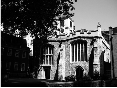
Kuvan oikeassa reunassa näkyy toimistosiipi, jonka ovi on vastakkaisella seinällä.

St. Helen Bishopsgate on yksi harvoista muurin sisäpuolella sijainneista keskiaikaisista kirkoista, jotka välttyivät sekä suurelta palolta että saksalaisten pommeilta. Kirkko rakennettiin alun perin