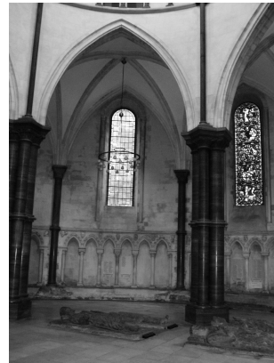
Turistit ovat erityisen kiinnostuneita temppeliherrojen hautamuistomerkeistä.

luvun alussa paikalla oli lisäksi vain huoltomies korjaamassa lamppuja.