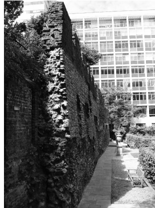
Muurin alin näkyvä osa on roomalaismuurin yläosaa, keskiosa on keskiaikainen korotus ja yläosan punatiili on Tudorien ajalta.

London Wall Vanhaa kaupunginmuuria on vielä pätkittäin jäljellä, ja ehkä hienoin pala löytyy St. Alphage Gardenista (toisinaan St. Alfège Garden) modernilta Barbicanin alueelta. Barbicanin sokkeloissa on helppo eksyä, mutta tähän pieneen puutarhaan pitäisi löytää helposti kääntymällä London Wall -kadulta pohjoiseen Wood Streetille. Seuraava katu oikealle on St. Alphage Garden, ja muuri näkyy heti vasemmalla. Muurin oikeasta reunasta laskeutuvat portaat varsinaiseen puutarhaan, jossa olet siis keskiaikaisen Lontoon ulkopuolella. Muurin reitin voi halutessaan kulkea säilyneeltä osalta toiselle opastauluja seuraten (ks. esim. www.london-footprints.co.uk/wklondonwallroute.htm ).