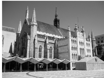
Vanha Guildhall on nykyään Cityn keskushallinnon modernien rakennusten ympäröimä.

Guildhall Vain tämä 1400-luvun Great Hall on jäljellä keskiaikaisesta kiltatalosta, ja sekin on osittain rakennettu uudelleen niin suuren palon kuin toisen maailmansodankin jälkeen. Guildhall sijaitsee Guildhall Yardilla, jonne pääsee sekä Gresham Streetiltä King Streetin kohdalta että Basinghall Streetin puolelta. Sisälle Guildhalliin pääsee pihan vasemmalla reunalla olevan aulan kautta. Vastaanottovirkailija opastaa sinut eteenpäin, ellei salia ole suljettu jonkin tapahtuman vuoksi. Vastaanotosta voi myös tiedustella pääsyä kryptaan, jonne vaaditaan valvoja mukaan.