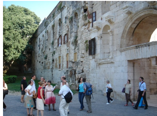
Kuva 3. Seminaarilaisia Diocletianuksen palatsin ulkopuolella.

Virallinen ohjelma päättyi iltapäiväretkeen Salonan arkeologiselle alueelle ja Trogirin keskiaikaiseen kaupunkiin. Seminaari onnistui kaiken kaikkiaan erinomaisesti sekä järjestäjien että osallistujien mielestä. Intensiivinen ohjelma ja yhdessäolo myös illallisilla siivitti lukuisia keskusteluja osallistujien kesken ja syvensi erilaisia yhteistyön muotoja. Päivien aikana sai alkunsa idea dominikaanireformia käsittelevästä workshopista Dubrovnikissa syksyllä 2009; samoin sovittiin seuraavasta kansainvälisestä hagiografia-konferenssista ja tämänkertaisen seminaarin papereiden julkaisemisesta.