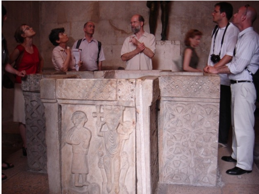
Kuva 2. Osallistujat tutustumassa Diocletianuksen palatsiin, jonka Jupiterin temppeli muutettiin kastekappeliksi