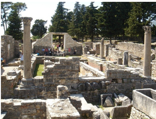
Kuva 4. Salonan varhaiskristillinen basilika.

Virallinen ohjelma päättyi iltapäiväretkeen Salonan arkeologiselle alueelle ja Trogirin keskiaikaiseen kaupunkiin. Seminaari onnistui kaiken kaikkiaan erinomaisesti sekä järjestäjien että osallistujien mielestä. Intensiivinen ohjelma ja yhdessäolo myös illallisilla siivitti lukuisia keskusteluja osallistujien kesken ja syvensi erilaisia yhteistyön muotoja. Päivien aikana sai alkunsa idea dominikaanireformia käsittelevästä workshopista Dubrovnikissa syksyllä 2009; samoin sovittiin seuraavasta kansainvälisestä hagiografia-konferenssista ja tämänkertaisen seminaarin papereiden julkaisemisesta.