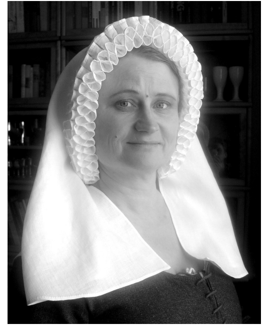
Valmis röyhelöhuntu s-reunalla.

Viikonloppu hujauti nopeasti hyvässä seurassa mielenkiintoiseen aiheeseen uppoutuen. Hieno tunne opettajalle oli, että kaikki